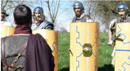
Entraînement des légionnaires romains à la fin du 1 er siècle. Ausbildung römischer Legionäre am Ende des 1. Jahrhunderts.

Guerres Historiques ist ein Verein mit Sitz in Drusenheim im Unter-Elsass. Er besteht aus Freiwilligen, die sich für Geschichte mit Begeisterung interessieren. Ihre Aktivitäten umfassen mehrzeitige historische Rekonstruktionen, archäologische Forschungen, archäologische Experimente, Erhaltung und Bewahrung des Erbes, aber auch Ausführungen in der Öffentlichkeit zur Vermittlung von Wissen und zur Entdeckung der Geschichte.