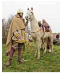
Cavaliers Alémaniques. Germanische Kavallerie.