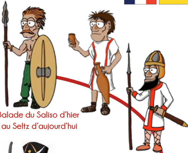
Balade du Saliso d'hier au Seltz d'aujourd'hui